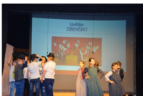
Tretješolci in ljudski ples