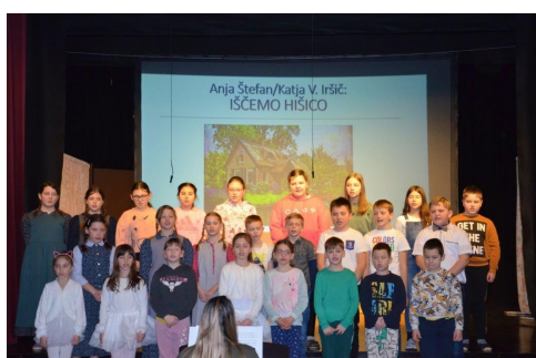
Otroški pevski zbor