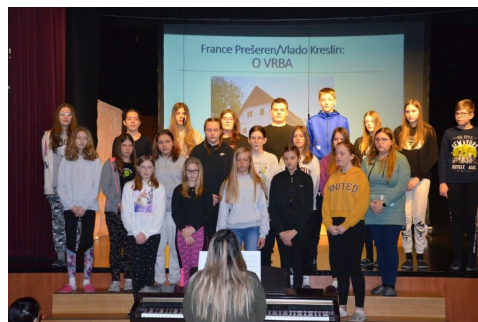
Mladinski pevski zbor