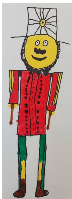
Kris Forneci Solero