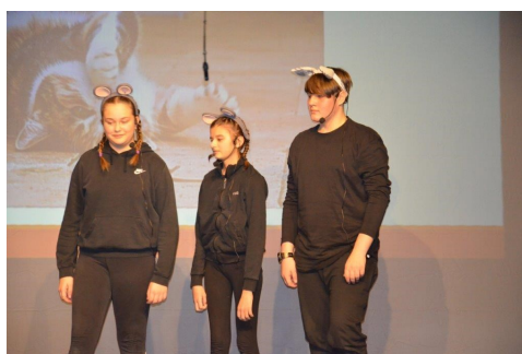
Basen Mačka, miš in miška