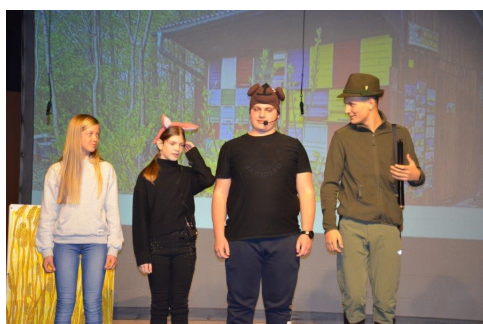
Basen Medved in lisica