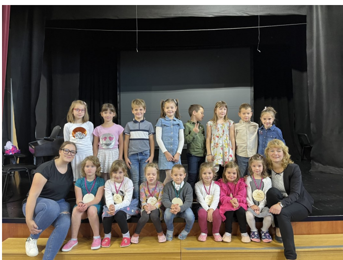
Učenci 1. in 2. razreda s svojima učiteljicama