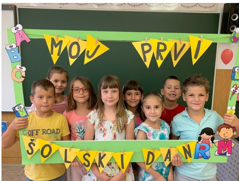
Učenci 2. razreda