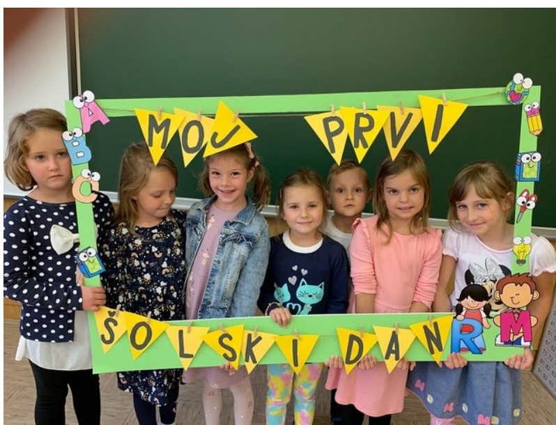
Učenci 1. razreda