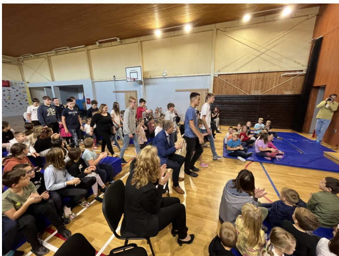
Prvošolci v spremstvu devetošolcev