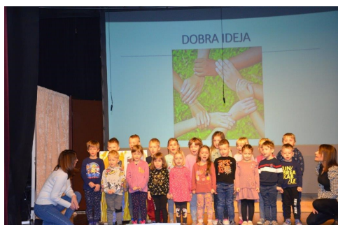
Vrtec z deklamacijo